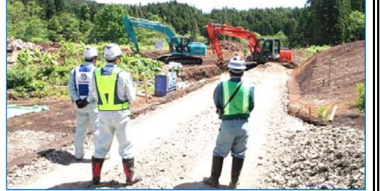
函館江差自動車道木古内町 幸連橋下部外一連工事

アクセス道路を施工中でした。小河川を跨ぐための横断管を布設する作業を行っていましたが、発電機や細やかな資材がきれいに整えられ、作業する人々の意識の高さを感じました。